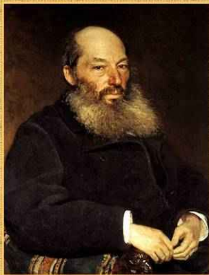
Портрет Фета кисти И.Е.Репина

В 1873 г. за Фетом была утверждена фамилия отца со всеми связанными с нею правами. Он получает дворянство и становится дворянином Шеншиным. И.С.Тургенев не без иронии говорит ему: «Как Фет вы имели имя, как Шеншин вы имеете только фамилию».