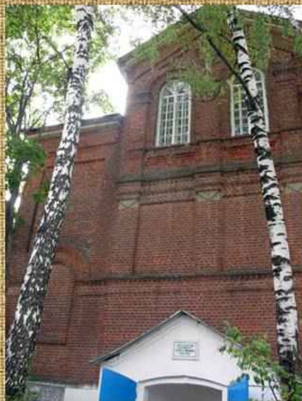
Вид на церковь, в которой погребен Фет

Скончался Фет 21 ноября 1892 г. в Москве, не дожив двух дней до 72 лет. Похоронен в родовом имении Шеншиных в селе Клейменове, в Мценском уезде, в 25 верстах от Орла.