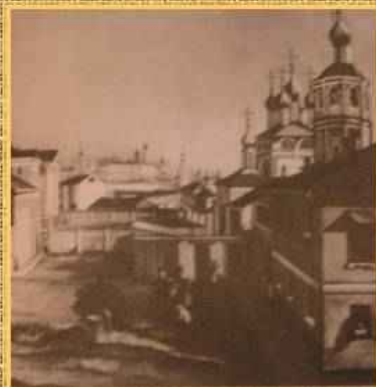
Деревня Новосёлки Орловской губернии

Афанасием Фетом. Это был страшный удар по самолюбию подростка. Он долго не мог смириться с потерей дворянского сословия. Этот факт, на первый взгляд, не такой уж страшный для молодого человека, оказался сопутствующим в формировании характера, отягченного комплексом неполноценности. Долгие годы поэт добивался получения дворянства.