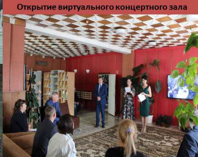
Открытие виртуального концертного зала