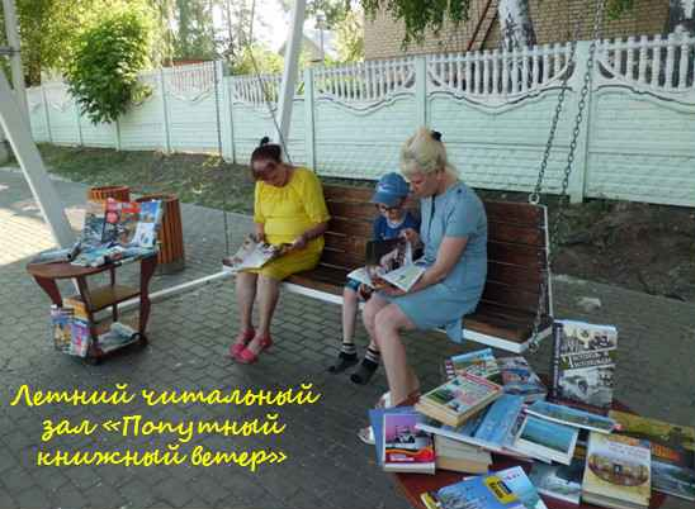
Летний читальный зал «Попутный книжный ветер»