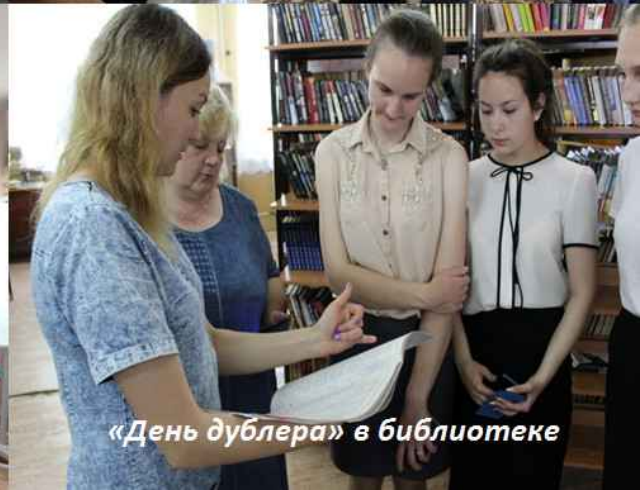
«День дублера» в библиотеке