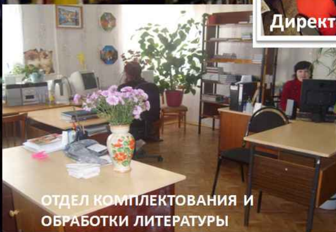
ОТДЕЛ КОМПЛЕКТОВАНИЯ И ОБРАБОТКИ ЛИТЕРАТУРЫ