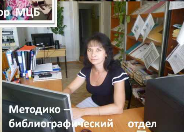
Методико — библиографический отдел