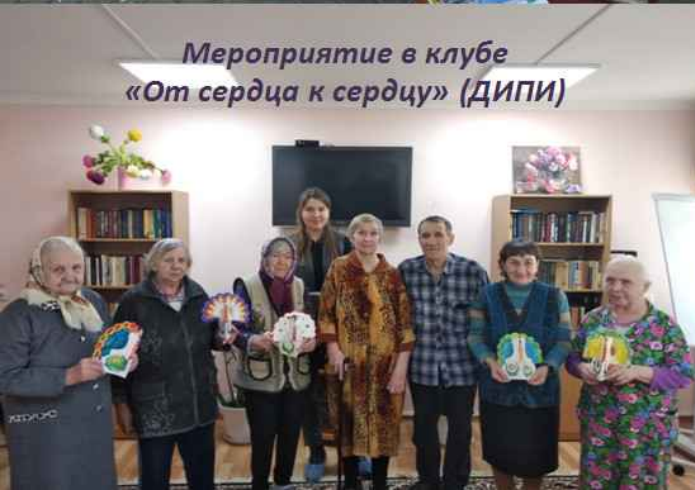
Мероприятие в клубе «От сердца к сердцу» (ДИПИ)